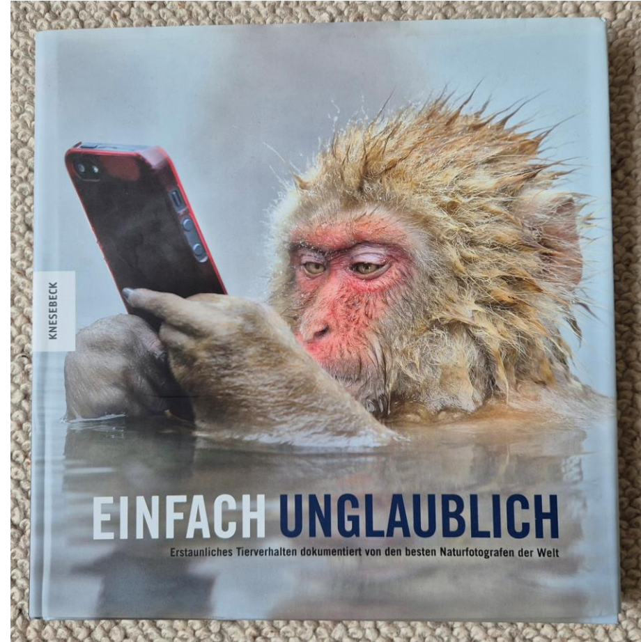
Marsel van Oosten / Knesebeck - no_ai