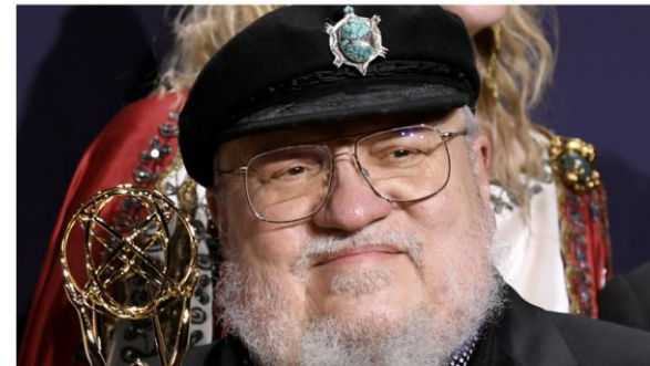
Autor George R.R. Martin hat Game of Thrones selbst nicht fertiggeschrieben (hier bei der Emmy-Verleihung 2019).